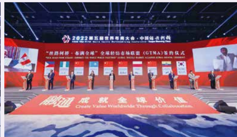
系列活动彰显柯桥融通全球纺织业的决心。