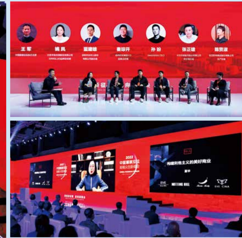
与会嘉宾共探服装行业发展之路。

11月18日，2022 中国服装论坛高精尖创新峰会在江西于都举行。本届峰会由中国服装论坛牵手于都共同举办，峰会以“时尚新征程，迈向高精尖”为主题，迎着中国服装产业“十四五”良好开局，全力发展高精尖产业带动区域科技创新与成果转化，打造世界级品牌的高端制造高地。创新峰会由中国服装协会主办，于都县人民政府、北京盛世嘉年国际文化发展有限公司承办。