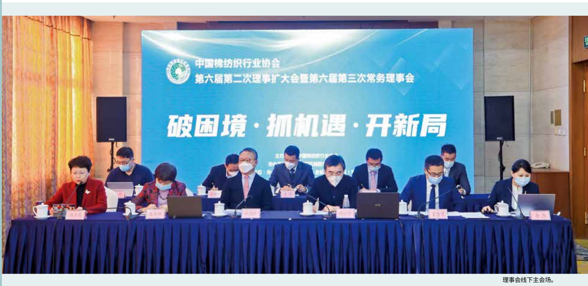
理事会线下主会场。