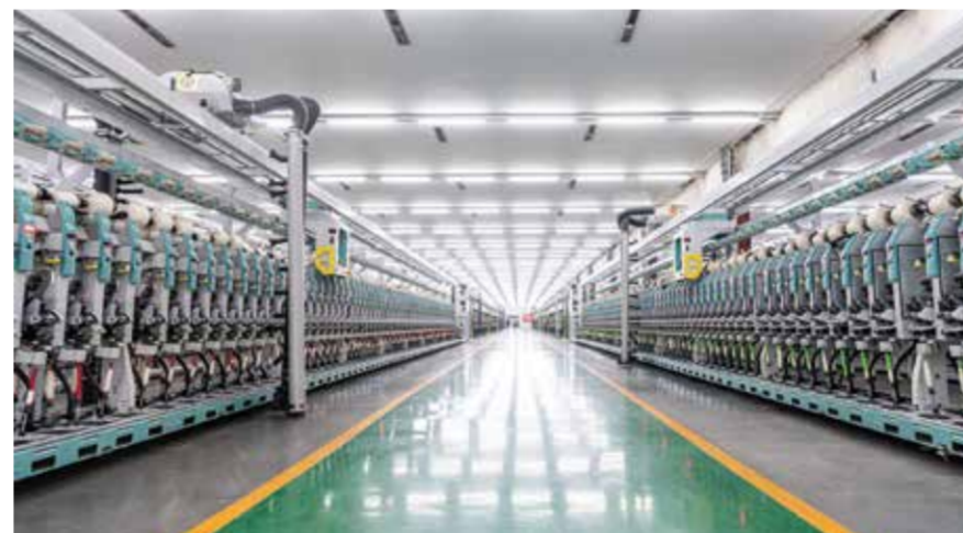
无锡一棉生产车间。

以“智改数转”为动力，走智能制造之路、循环利用之路、绿色发展之路。加大科技研发力度，积极研发具有市场潜力的新品、精品，打造优质、经典、特色产品，提升企业核心竞