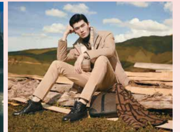
劲霸始终以高端新国货战略为指引。