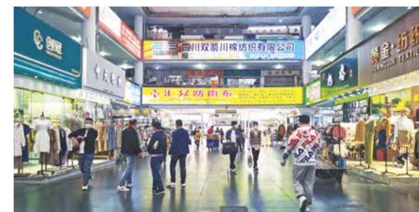
柯桥将继续加快打造现代化“国际纺都、杭绍星城”。

不拒众流，方为江海。“一带一路”拉紧了绍兴柯桥与沿线国家互利互惠的纽带，世界布商大会进一步提升绍兴柯桥在全球纺织价值链中的发言权。高标准举办世界布商大会正是柯桥积极抢抓“一带一路”战略机遇的深刻实践，推动绍兴柯桥的大门将越开越大，“开放路”越走越顺，“朋友圈”