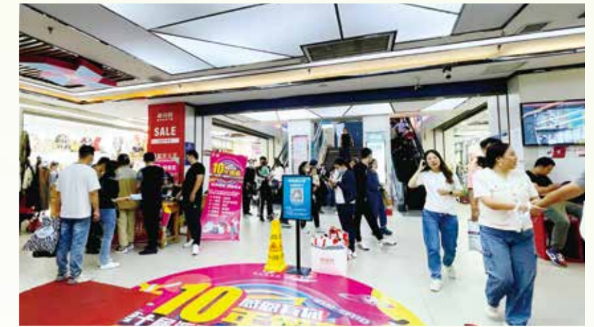
山东纺织以更多活动进一步促进消费复苏。

域的角度建议到，当前数字技术催生了消费新业态新模式，为流通领域带来新的挑战，未来要紧抓数智化转型的机遇，依托信息化技术手段，推动市场数字化、信息化、智慧化转型，满足消费者多元化、个性化、定制化的消费需求，推动消费结构优化升级，赋能工业生产环节，为消费升级提供强有力的支撑。在扩大内需方面，稳经济大盘的过程中，应充分发挥流通引导生产、促进消费的作用，不断打通流通领域的堵点、断点和痛点，增加品牌商品和高品质商品的销售，带动更多线上平台和线下商业、服务业企业参与其中，通过数字化赋能共建全渠道业务平台，促进线上线下融合发展，从强调发挥商业价值、产业价值，进一步延伸到更好地发挥社会价值。