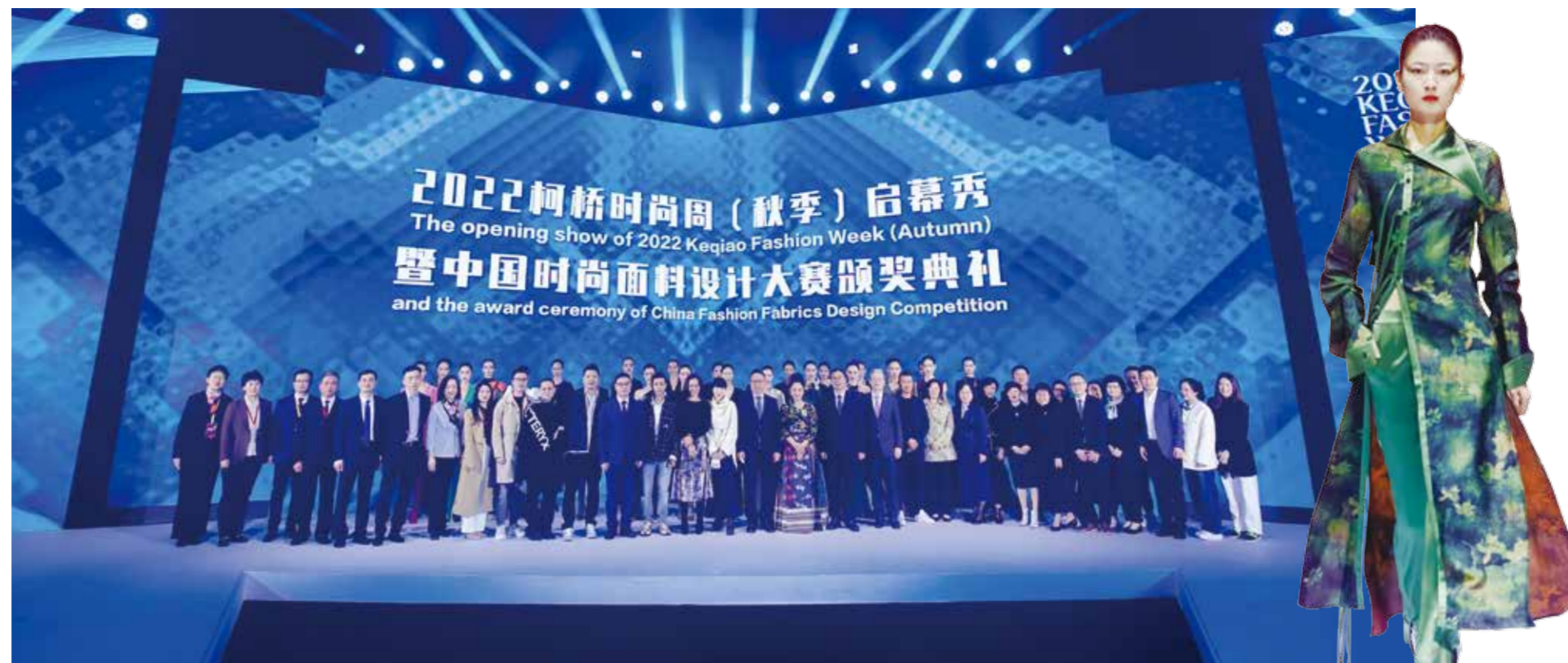
本届时尚周是柯桥时尚创意产业蓬勃发展的缩影。