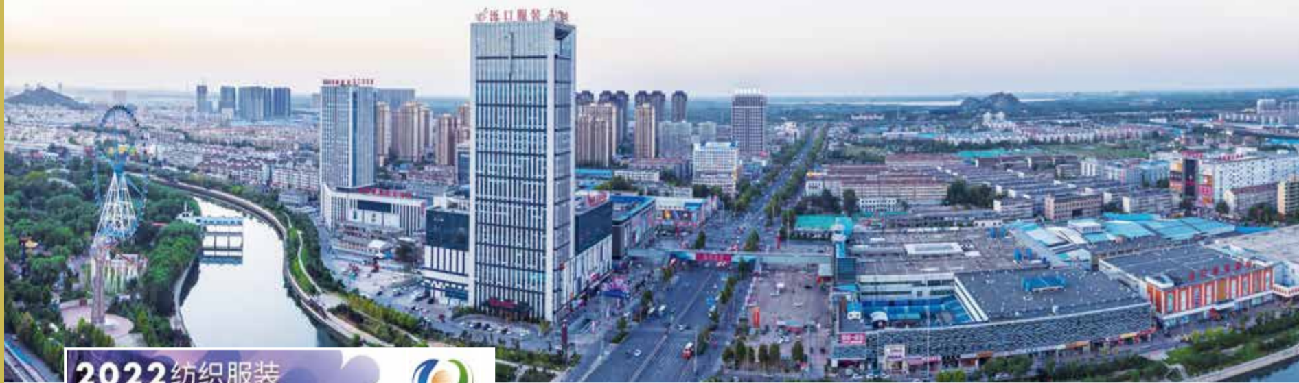
“优供给促升级”系列活动激发山东纺织产业活力。